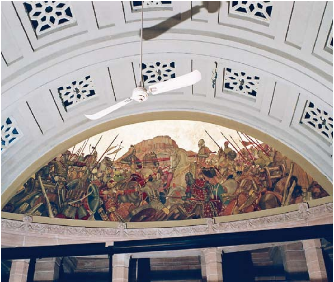
Fot. 3. Malowidło ścienne „Bitwa założyciela miasta Radhora przeciwko Mogołom” d. hol obecnie sala muzealna pałacu Jodhpur

małej wilgotności powietrza w pomieszczeniu (20 – 30 %), zbyt wysokiej temperatury dochodzącej czasami do 54°C w cieniu w miesiącach czerwiec - sierpień oraz zastosowaniu kruchej pobiałej (podkładu) pod malowidłami o małej spoistości.