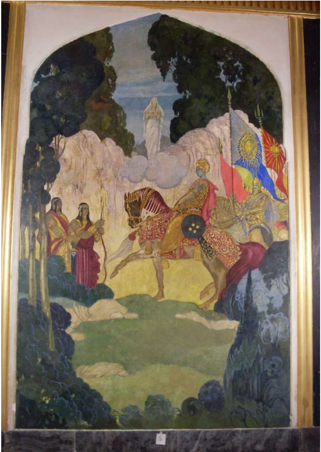
Fot. 19. Malowidło ściennie V w Sali Tronowej po konserwacji