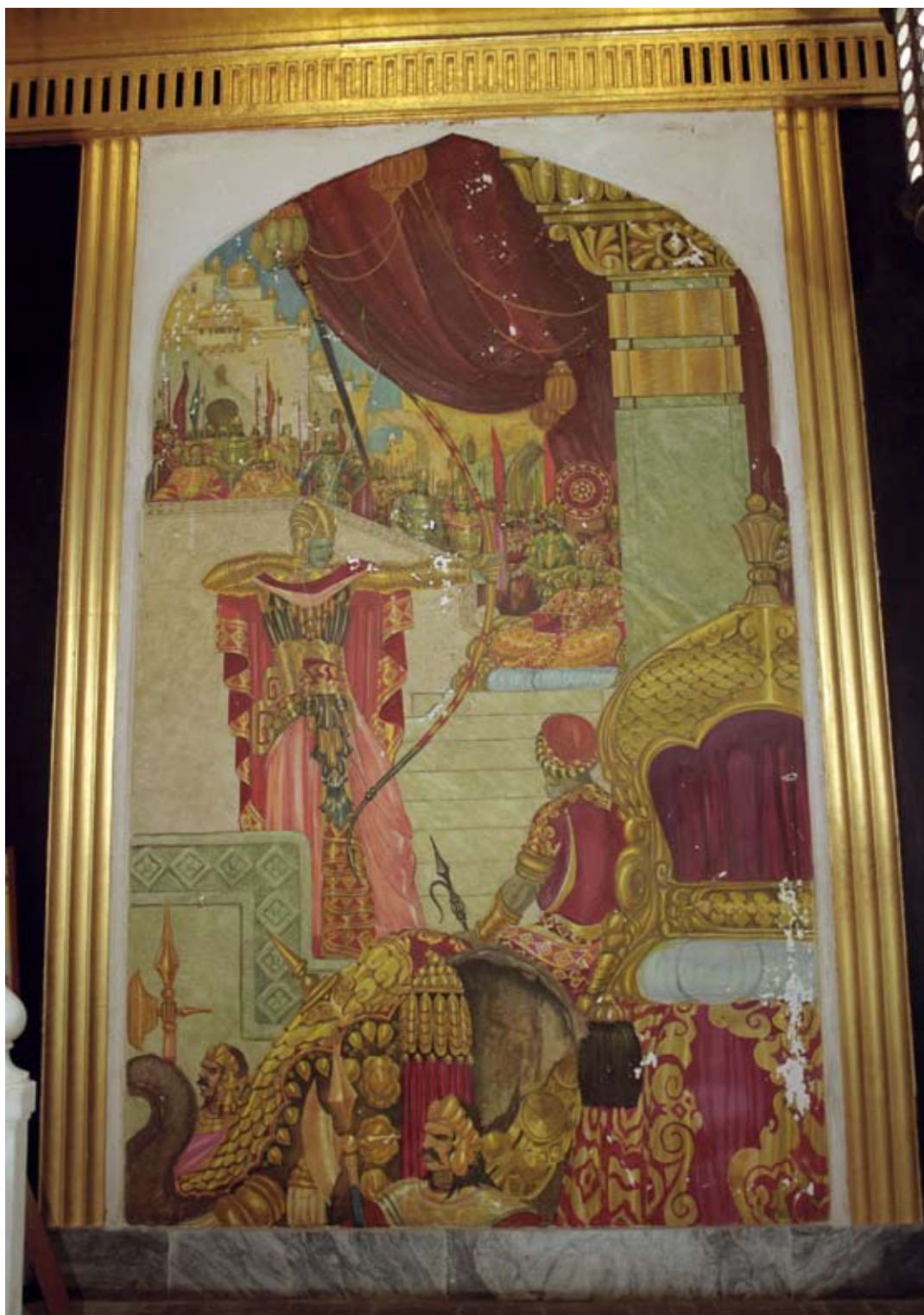
Fot. 5 . Malowidło ściennie I w Sali Tronowej przed konserwacją