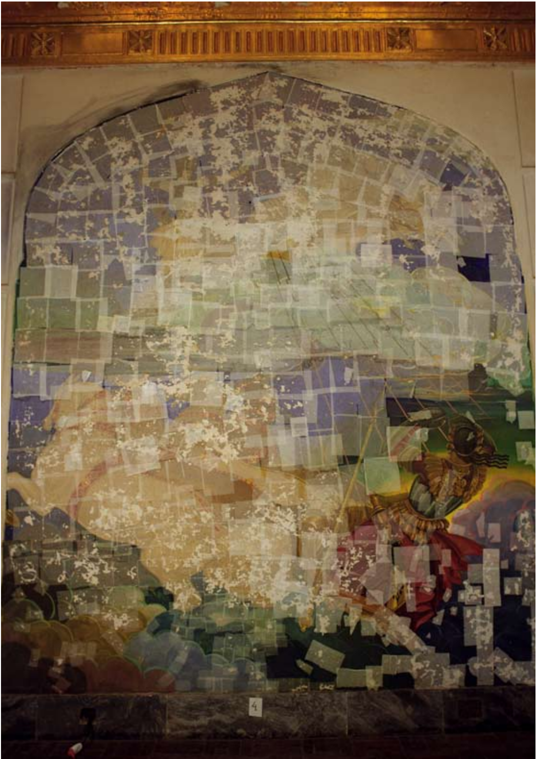
Fot. 12. Malowidło ściennie IV w Sali Tronowej po zabezpieczeniu bibułką japońską