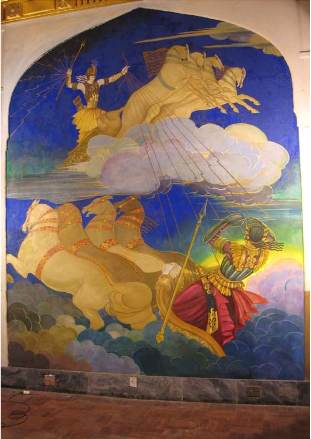
Fot. 14. Malowidło ściennie IV w Sali Tronowej po konserwacji