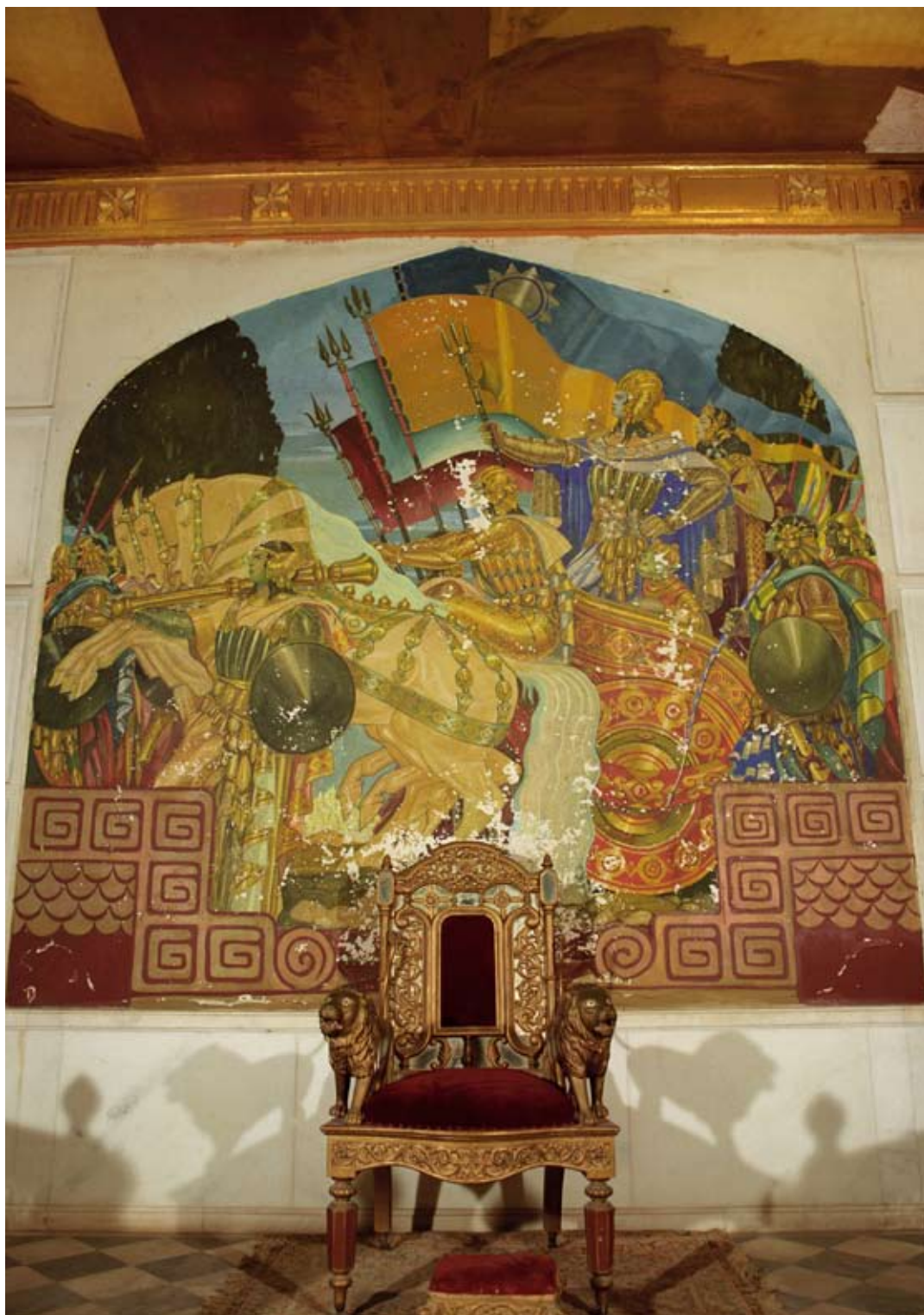
Fot. 11. Malowidło ścienne VI w Sali Tronowej przed konserwacją