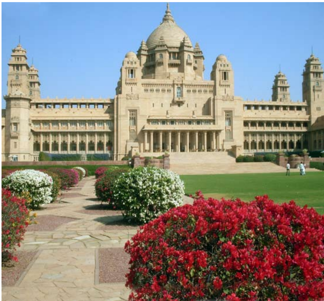
Fot. 1. Pałac Umaid Bhawan w Jodhpur – Indie