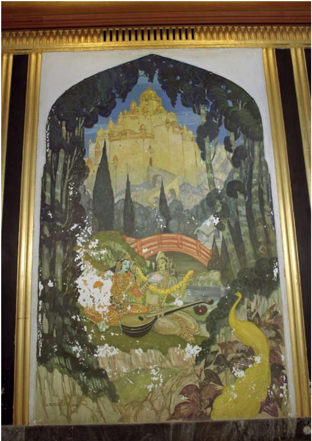
Fot. 6. Malowidło ściennie II w Sali Tronowej przed konserwacją