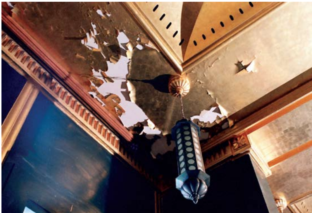
Fot. 20. Fragment plafonu Sali Tronowej przed konserwacją