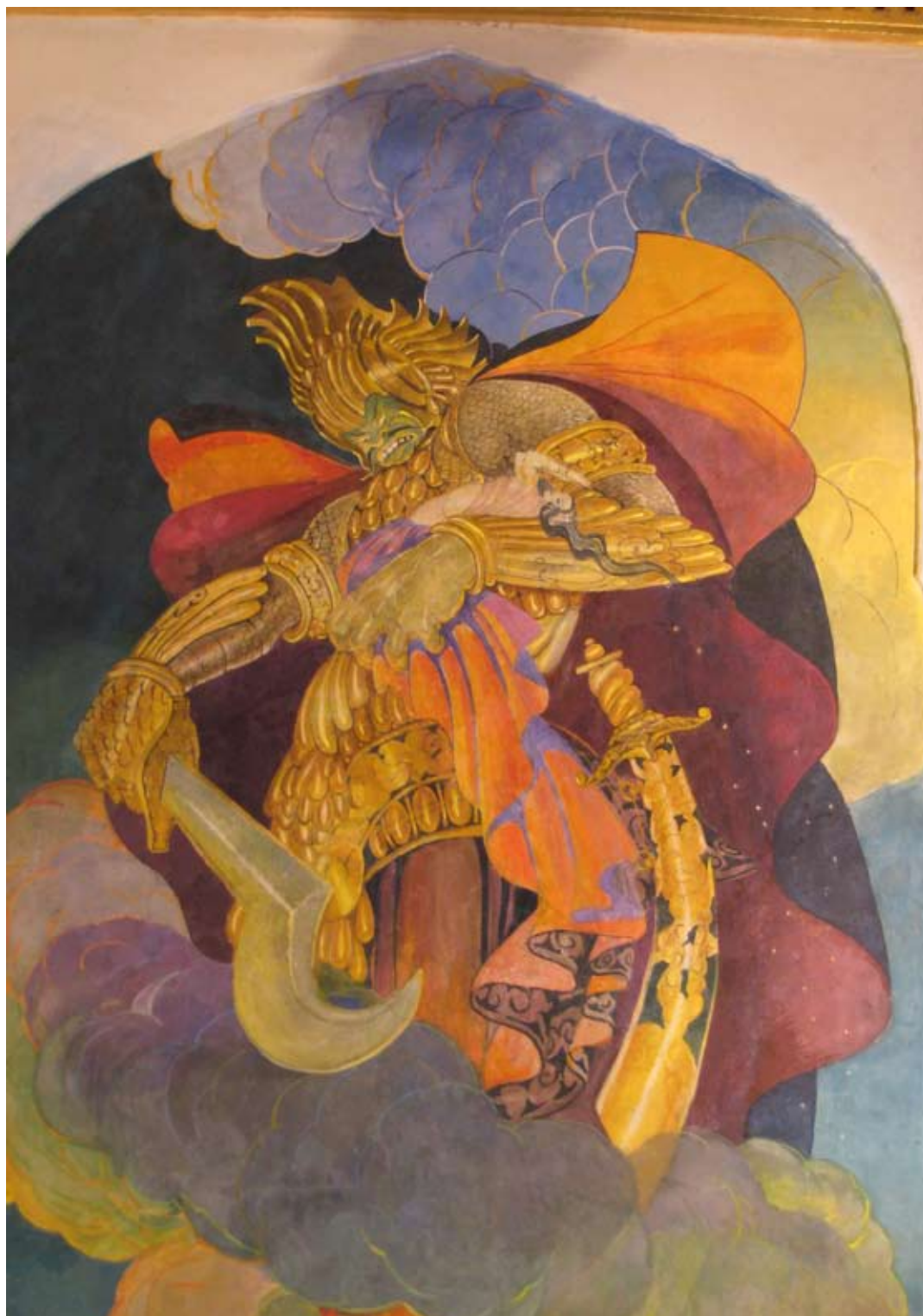
Fot. 15. Malowidło ścienne III w Sali Tronowej po konserwacji