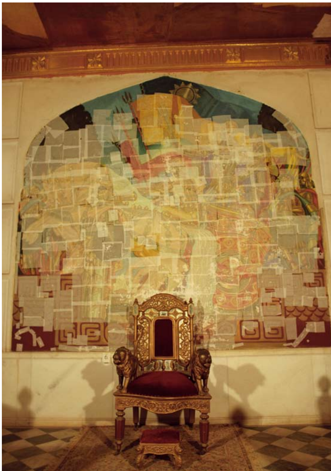
Fot. 13. Malowidło ścienne VI w Sali Tronowej po zabezpieczeniu bibulką japońską