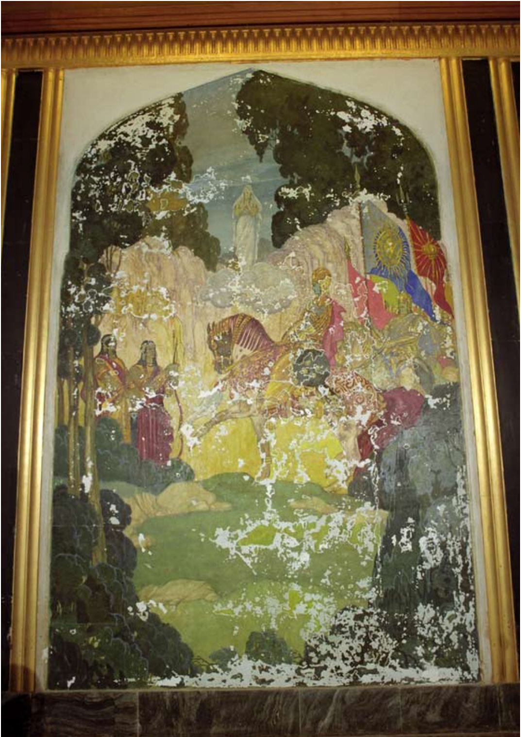
Fot. 10. Malowidło ściennie V w Sali Tronowej przed konserwacją