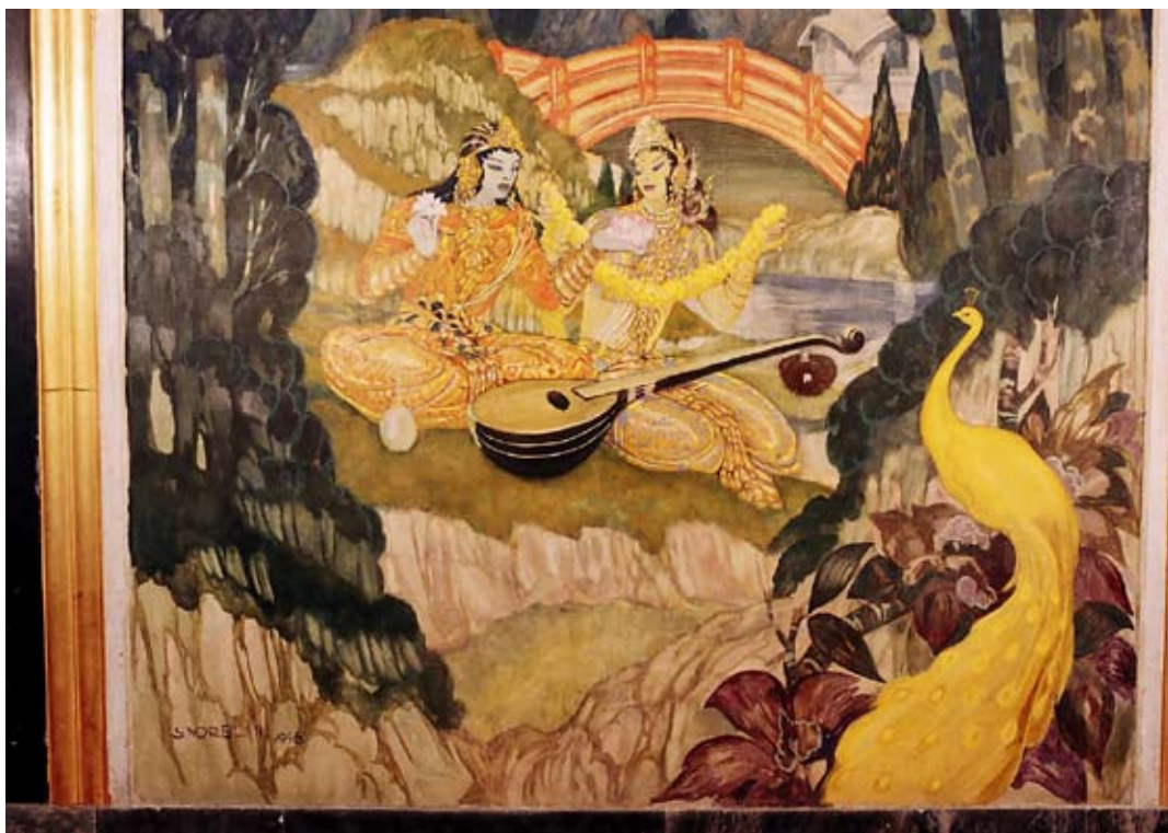
Fot. 17. Fragment malowidła ściennego II w Sali Tronowej po konserwacji