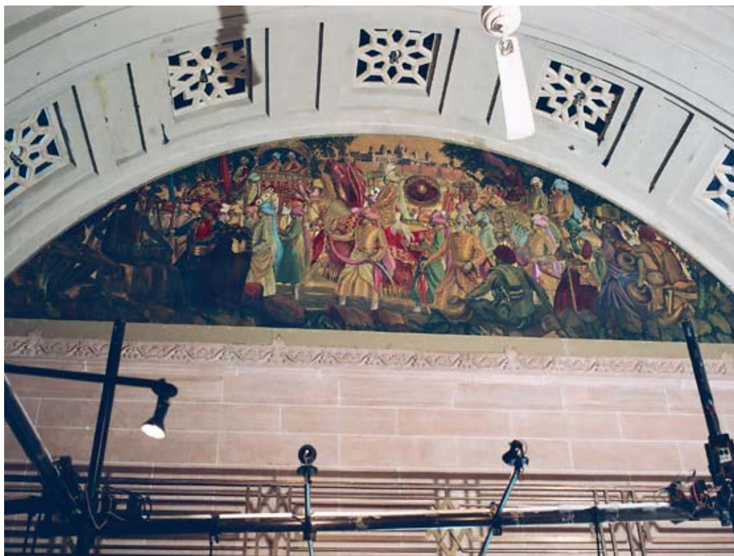
Fot. 2. Malowidło ścienne „orszak ślubny maharadzy w d. holu obecnie sala muzealna pałacu Jodhpur.