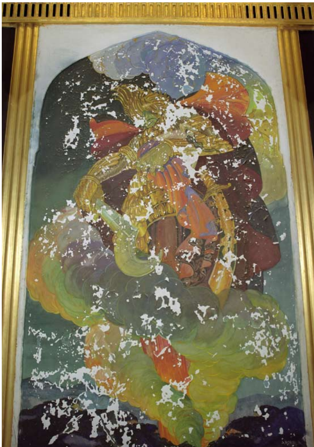
Fot. 7. Malowidło ściennie III w Sali Tronowej przed konserwacją