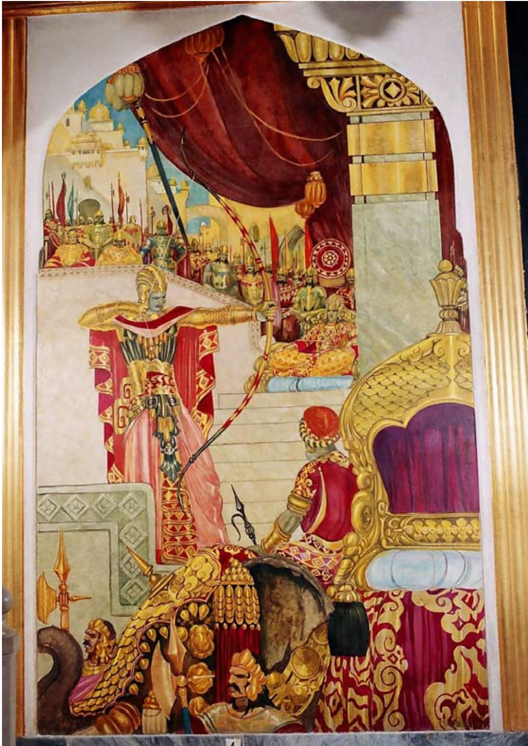
Fot. 16. Malowidło ściennie I w Sali Tronowej po konserwacji