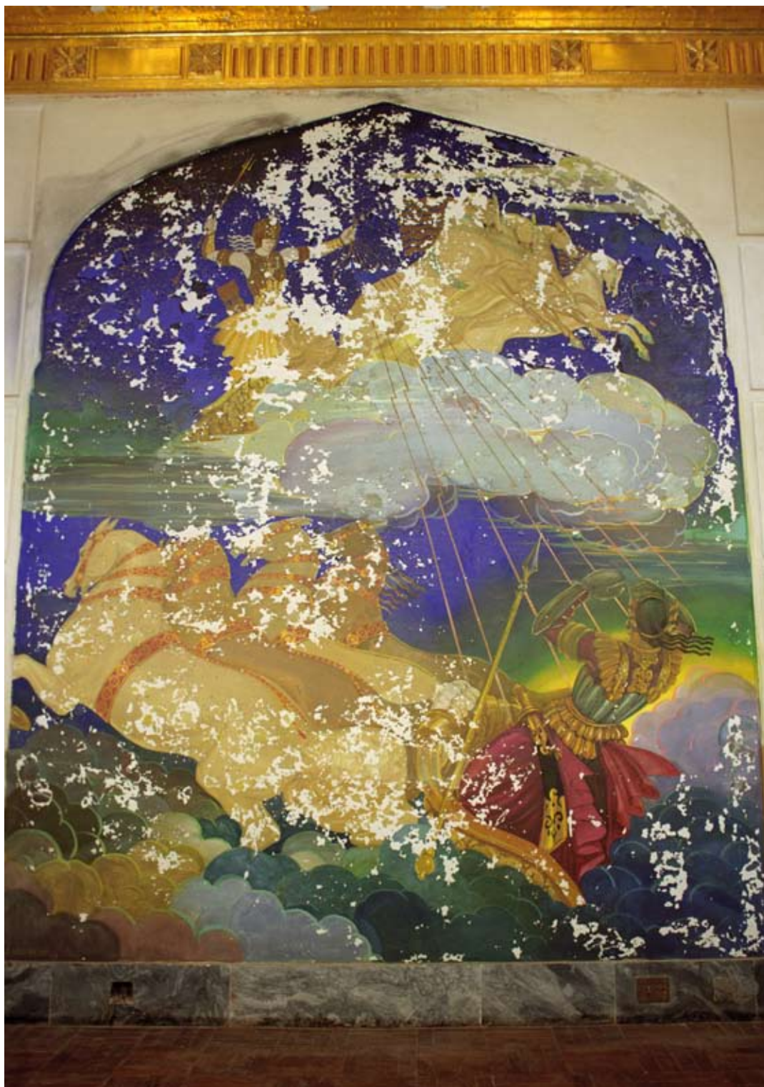
Fot. 9. Malowidło ścienne IV w Sali Tronowej przed konserwacją