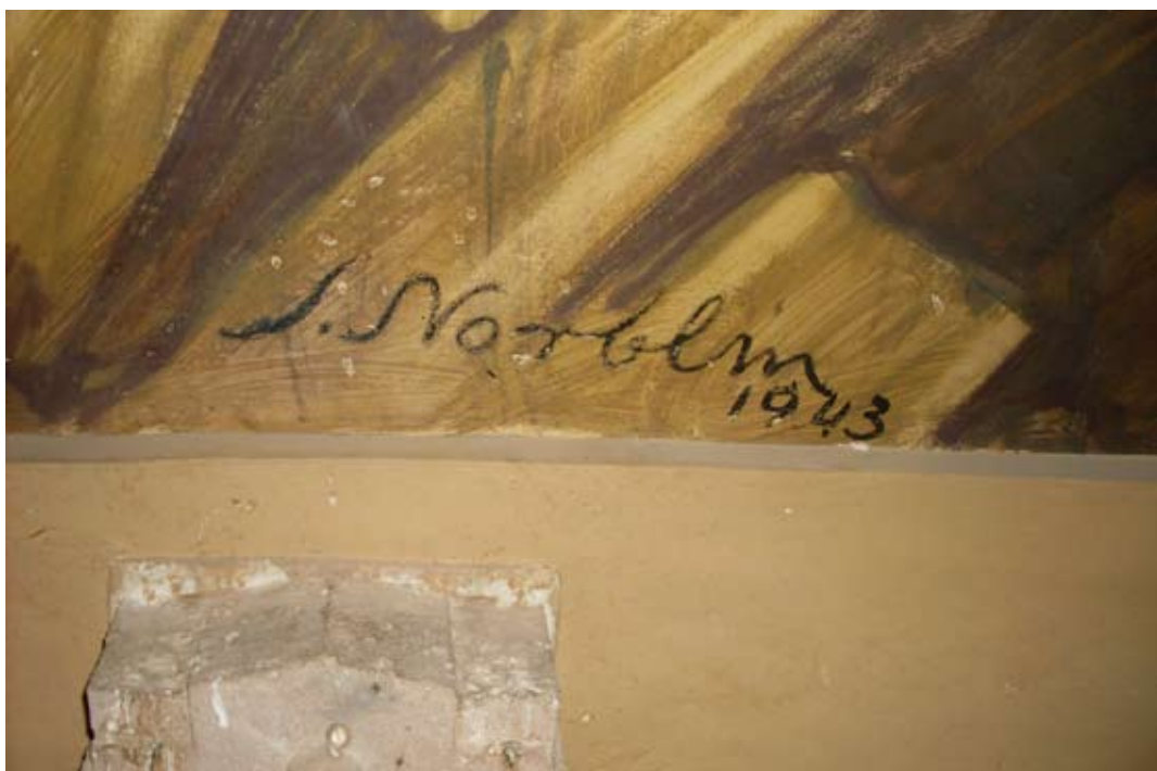
Fot. 21. Sygnatura S. Norblina na malowidle ściennym w d. holu obecnie sala muzealna pałacu