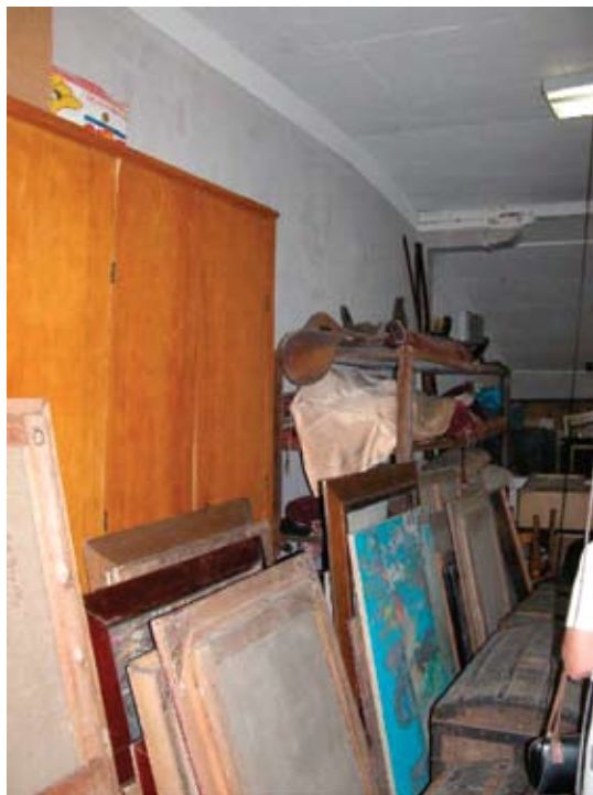
Muzeum Historyczne Miasta Tbilisi, jedno z pomieszczeń, gdzie przechowywane są obrazy i inne muzealia. Fot. z roku 2007.