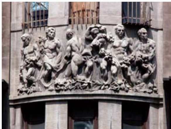
Tbilisi. Dom (czynszowy) Melika Azarjanta wybudowany w latach 1912–1915 wg proj. Mikołaja Obołońskiego. Fragment fasady z dekoracją figuralną. Fotografia z roku 2009.

Mikołaj Obołoński był zainteresowany działalnością w Gruzji (podobnie jak inni architekci). Świadczy o tym jego udział w konkursie na budynek Banku Gruzjińskiego ogłoszonym w roku 1913. Projekt Obołońskiego zajął jednak II miejsce i dom Przy Alei Rustawelego pozostał jego docenianą, znakomitą, acz jedyną realizacją.