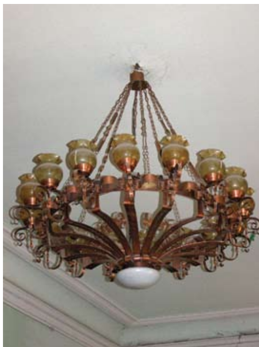
Tbilisi. Budynek Muzeum Jedwabnictwa, wnętrze. Projekt A. Szymkiewicz. Fotografia z roku 2007.