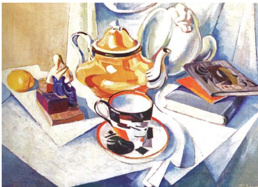
Cyril Zdaniewicz, „Martwa natura z czajnikiem”. Olej na płótnie, 82 x 65cm, 1919 rok. Gruzjińskie Narodowe Muzeum Sztuki.

Dokonywania artystyczne Polaków w Gruzji obejmujące II połowę XIX w. i dużą część wieku XX pokazane zostały poprzez działania poszczególnych architektów, malarzy, rzeźbiarzy. Brak jest opracowań syntetyzujących zjawiska artystyczne na Kaukazie w okresie ostatnich dwustu lat. Konieczne są pogłębione badania archiwalne i dokumentacyjne 4 . Zainteresowanie Gruzją i innymi krajami Kaukazu wzmagane wydarzeniami politycznymi w tym rejonie powoduje publikacje coraz to nowych prac odslania-