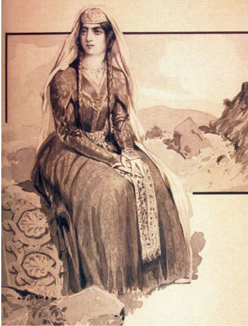
Henryk Hryniewski, „Matka Gruzji”. Tusz na papierze; ilustracja wykonana do „Dzieł zebranych Ili Czawczawadzego” Państw. Muz. Lit. Gruzji 2 .